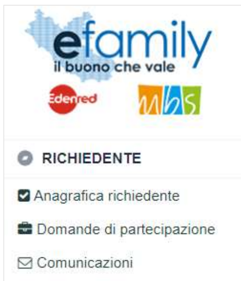
FIG. 17 – MENU DI SISTEMA.2

Nella schermata “Elenco comunicazioni” saranno presenti tutte le richieste d’integrazione e le eventuali altre comunicazioni del Sovventore con indicato lo stato della richiesta.