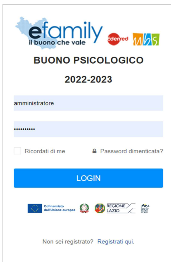
FIG. 2 – PAGINA DI LOGIN

Nel caso in cui il Richiedente smarrisca la password d’accesso sarà possibile richiederne una nuova cliccando su “Password dimenticata?” (Fig. 2). Sarà inviata una nuova password all’indirizzo email indicato al momento della registrazione.