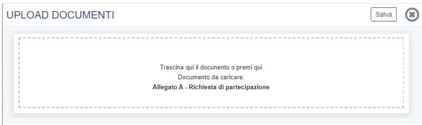
FIG. 9 – UPLOAD DOCUMENTI

Una volta caricato il documento è necessario cliccare sul pulsante Salva .